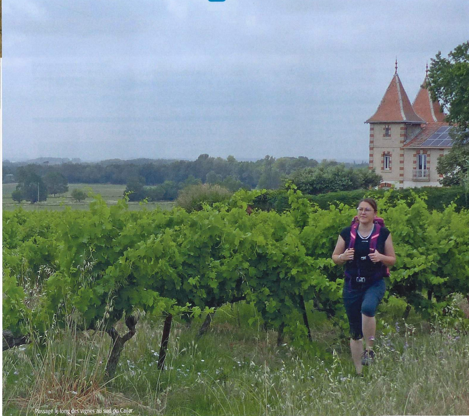
Passage le long des vignes au sud du Cailar.