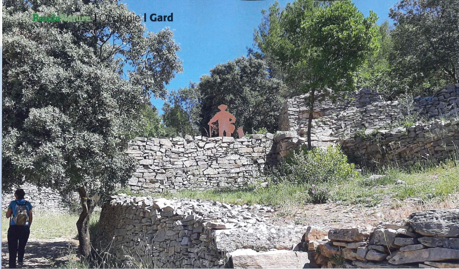
Dans la combe des Bourguignons à Marguerittes.