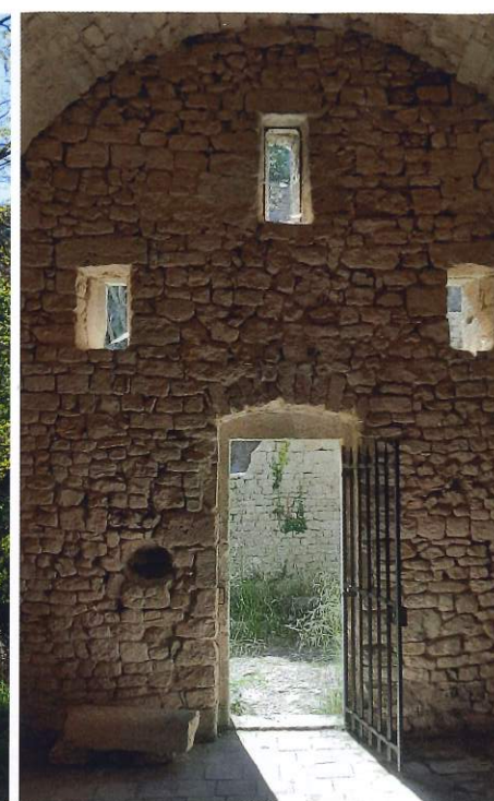
À l'intérieur de la chapelle Notre Dame de Laval, qui aurait été bâtie sur un ancien temple païen.

Puis vient le moment de monter. Quelques marches naturelles mènent à un point de vue en surplomb de l'ermitage. La grimpe continue sur une centaine de mètres avant de déboucher sur un sentier en pleine garrigue.