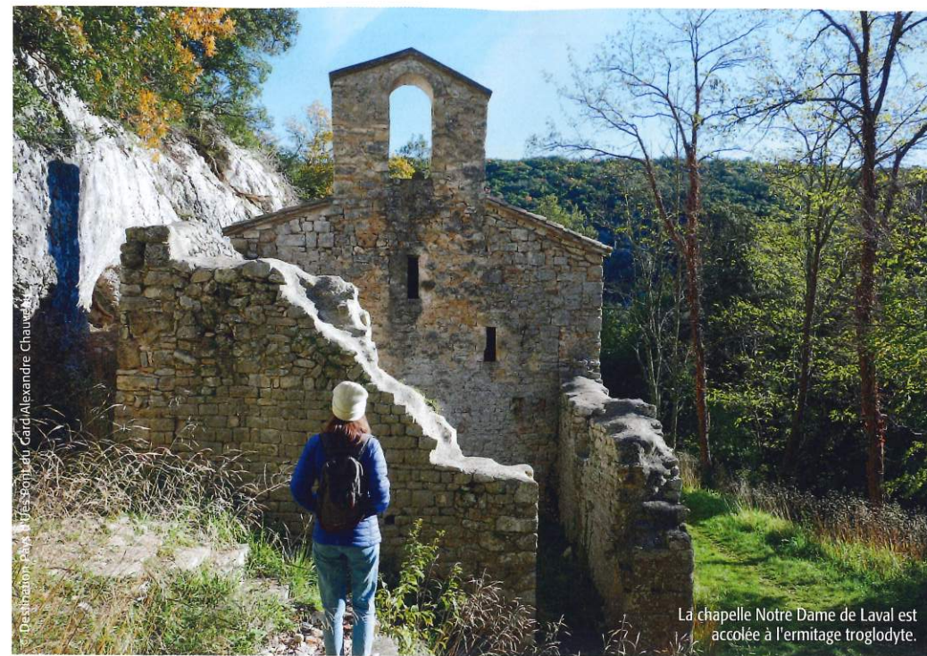
La chapelle Notre Dame de Laval est accolée à l'ermitage troglodyte.