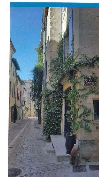
Il fait bon flaner dans les petites rues d'Uzès.

Puis vient un passage très doux au milieu d'une "olivette". Sous les branches des arbres, des panneaux expliquent les différentes sortes d'olives qui poussent dans ce conservatoire, mais aussi leur récolte, leurs maladies... « En 1956, tous les oliviers ont gelé, ce sont donc de