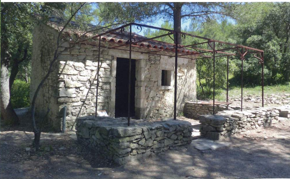
À Marguerittes, le mazet où des familles venaient déjeuner le dimanche.

Le chemin retour se fait à couvert, en passant devant plusieurs capitelles restaurées. Le sentier d'interprétation touche à sa fin en retrouvant la rigole d'irrigation, mais il est possible de continuer la balade puisque le lieu est parsemé de panneaux qui renvoient vers d'autres randonnées (de 1 à 6 km) et même une course d'orientation.