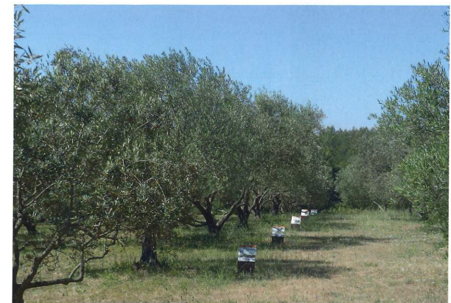
Panneaux explicatifs dans l'olivette.