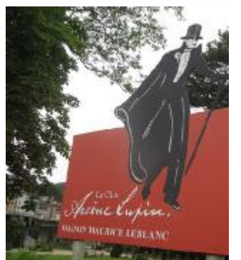
Etretat, casa Leblanc papà di Lupin