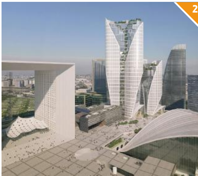
Il rendering delle Sisters Tours alla Défense alte 225 e 130 metri