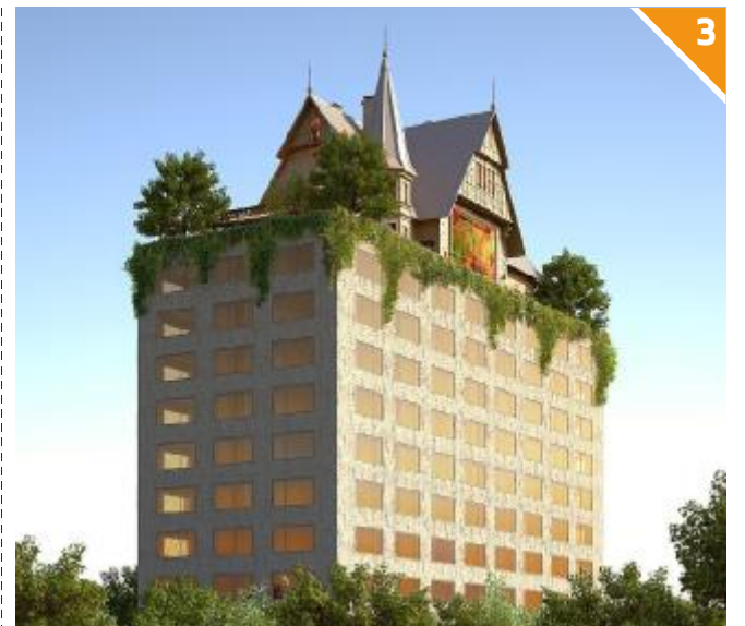
L'incredibile hotel progettato da Philippe Starck a Metz

UN CANTIERE PERMANENTE. Restauri di edifici prestigiosi, recuperi pubblico-privati e architettura dell'oggi: l'Oltralpe non si ferma, dalla Normandia al Grande Est