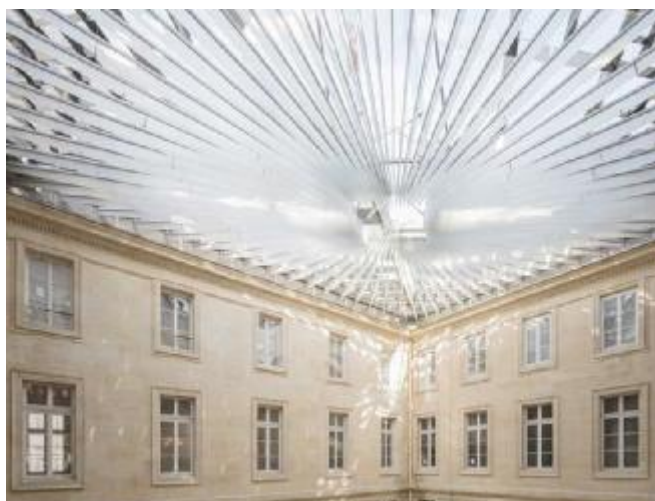
Un tetto a diamante nel cortile dell'Hôtel de la Marine a Parigi

Maurice Leblanc, il creatore di Arsenio Lupin. Nella casa museo si rivive l'avventura del ladro gentiluomo che di questi giorni è protagonista della serie su Netflix. Si celebrano poi i 200 anni della nascita dello scrittore Gustave Flaubert, di Rouen. Si trasferirà a Parigi per gli studi universitari entrando nei circoli intellettuali dell'epoca, salvo poi tornare a Croisset, lungo la Senna. La sua casa natale e il Pavillon Flaubert a Croisset, dove ha vissuto per 35 anni e ha scritto i romanzi, sono musei; nel non lontano villaggio di Ry (Yonville-l'Abbaye) ambientò Madame Bo-