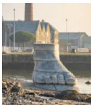
L'ultima installazione di Estuaire