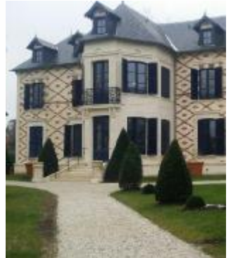
Cabourg, Casa Proust

Le Grand Palais chiude ma spunta al Campo di Marte un Palais effimero trasparente e provvisorio