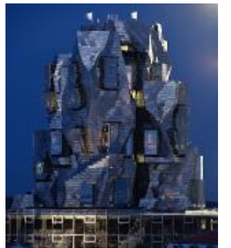
Arles, l'edificio di Frank Gehry

Dal sole del Sud all'affaccio sull'oceano a Nord: Nantes è un altro caso di città francese che ha convertito la sua vocazione industriale, la cantieristica navale, in cultura. Tra il centro città e l'estuario a Saint-Nazaire, i 60 km lungo la Loira sono stati trasformati in un percorso all'aperto con installazioni stupefacenti di artisti internazionali (dalla casa che sprofonda nel fiume al drago d'acciaio tra le onde, dal battello spiaggiato ai finti orsi sugli alberi, dalla casa-camino sul faro al belvedere dell'eremita) che si possono visitare in battello, in auto o lungo la ciclabile. Attirano migliaia di persone e quest'anno si è aggiunto il lavoro degli artisti Dewar e Gicquel che da gennaio sulla spiaggia hanno collocato un piede, un pullover e un tronco corporeo giganti. La città bretone si è dotata di una macchina organizzativa e delle idee chiamate Voyage à Nantes che promuove eventi e mostre, cura il Van il viaggio permanente estivo tra oltre 120 opere, lungo la linea verde che sull'asfalto conduce ai luoghi del divertimento e della cultura: il laboratorio delle gigantesche Machines, il castello dei Duchi di Bretagna, il Museo Jules Verne. N.M.