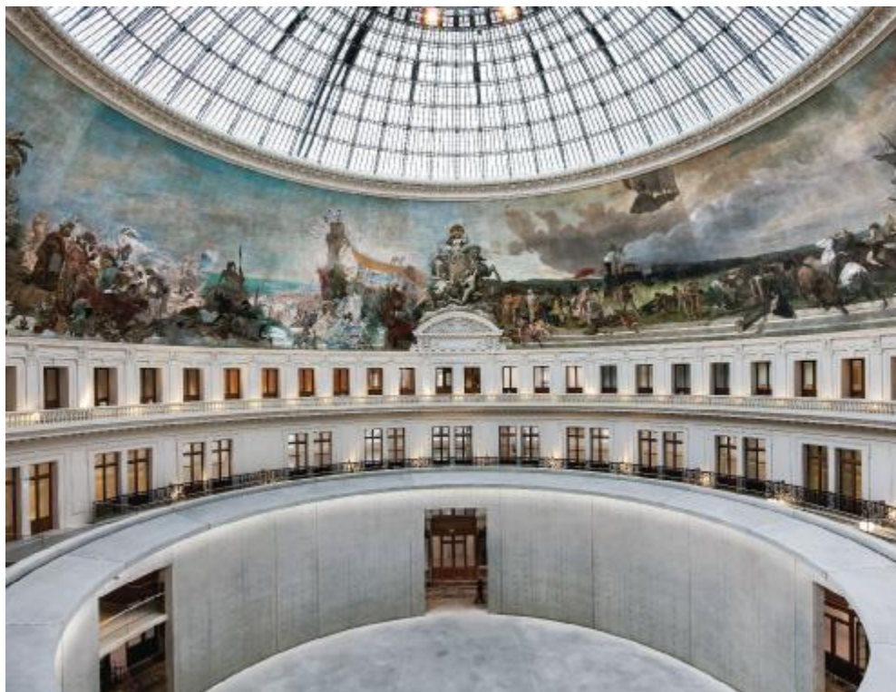
Alla Bourse de commerce l'architetto Tadao Ando ha inserito un cilindro per le collezioni di Pinault Lvmh

NORMANDIA. Ad Etretat, dipartimento della Senna Marittima, la visita alle spiagge e alle splendide falesie, riserva l'incontro col mistero: sono gli 80 anni della morte di