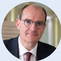
Jean Castex Premier ministre

« Conforter la France comme première destination touristique mondiale. » Voilà l'objectif fixé par le président de la République dans le cadre du premier Sommet Destination France le 4 novembre dernier. Depuis plus de 30 ans, la France est la première destination touristique mondiale. En 2019, 90 millions de touristes étrangers sont venus découvrir la richesse de notre patrimoine naturel et architectural, et profiter d'un art de vivre et de recevoir mondialement réputés. En France, le secteur touristique représente ainsi 8 % de la richesse nationale, grâce à des millions de femmes et d'hommes, passionnés de leurs métiers comme de leur pays, qui assurent chaque jour sa réputation d'excellence.