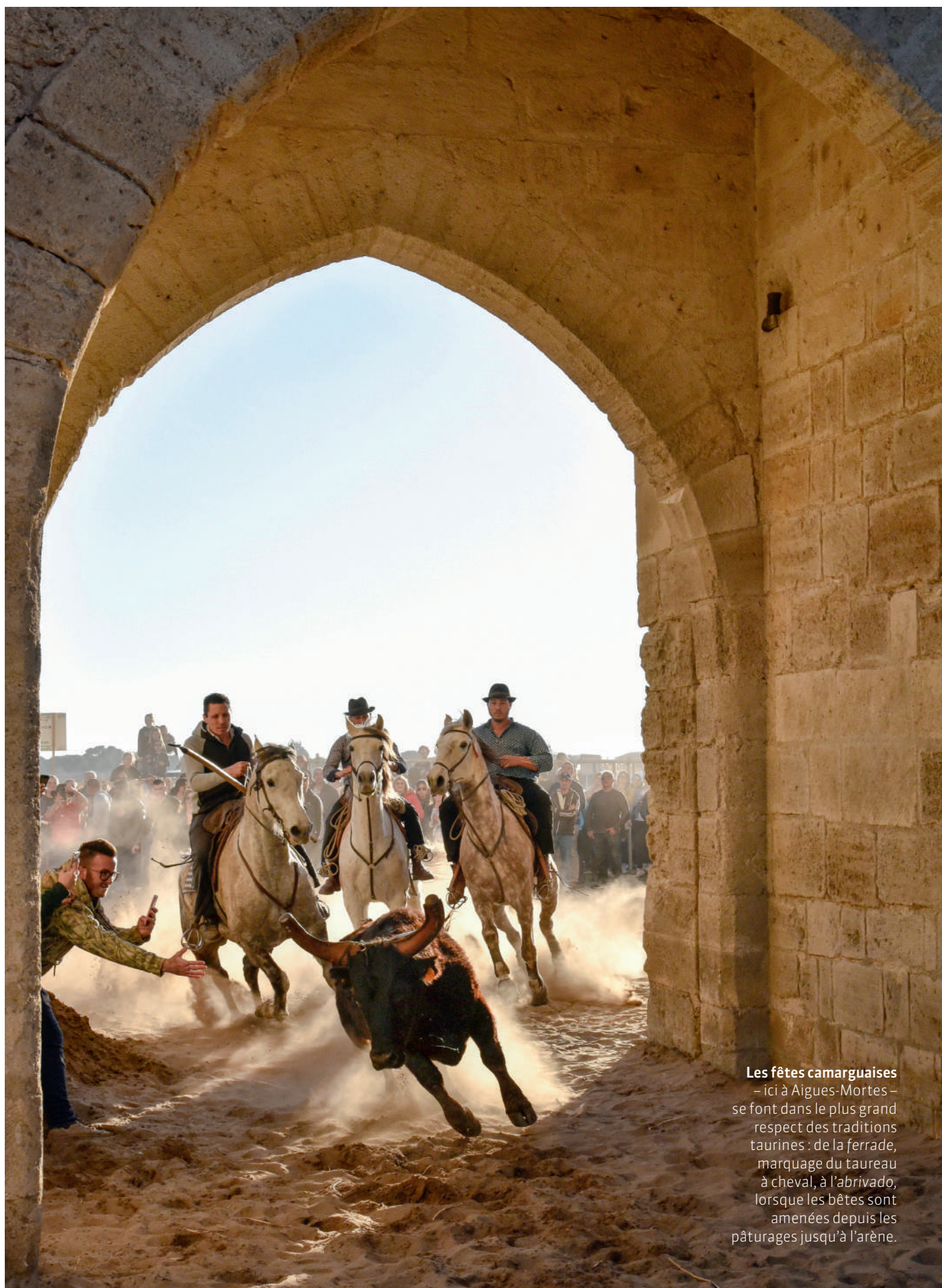
Les fêtes camarguaises – ici à Aigues-Mortes – se font dans le plus grand respect des traditions taurines : de la ferrade, marquage du taureau à cheval, à l'abrivado, lorsque les bêtes sont amenées depuis les pâturages jusqu'à l'arène.