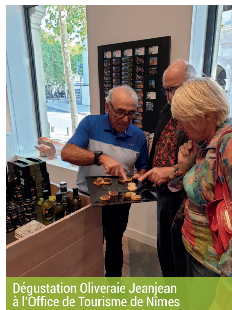
Dégustation Oliveraie Jeanjean à l'Office de Tourisme de Nîmes