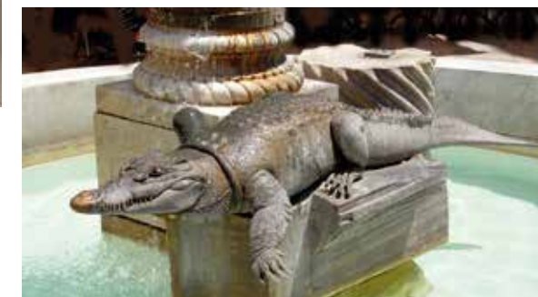
Après la campagne d'Egypte, certains des soldats d'Auguste s'installèrent à Nîmes. Leur victoire fut symbolisée par un crocodile enchaîné à un palmier. Réinterprétée par Philippe Starck dans les années 1980, l'illustration d'origine antique, disséminée dans la ville, ne manque pas de piquer la curiosité des visiteurs...