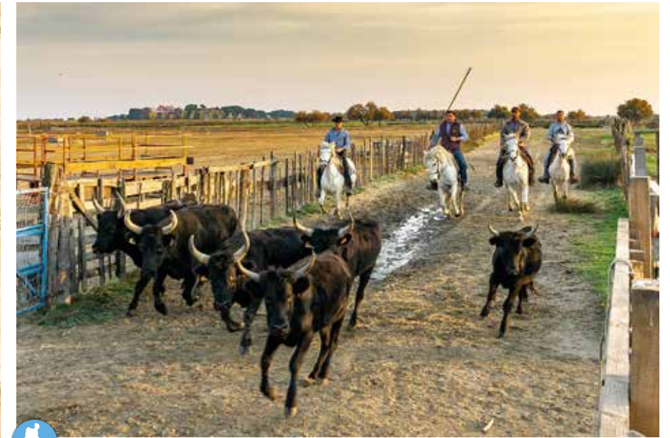
Manade Julian On visite la manade en calèche ou à cheval, on voit travailler les gardians, on découvre la puissance des taureaux... Avec sa vue sur les remparts d'Aigues Mortes et les camelles de sel, la manade Julian est le lieu idéal pour découvrir la Camargue. Mas Saint Pierre, Le Mole, D62, 30220 Aigues-Mortes - www.manadejulian.com