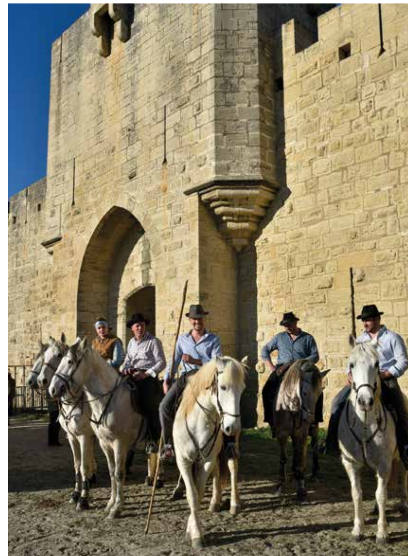
A cheval, les gardians vont chercher les taureaux dans les prés avant de leur faire traverser la ville... Au grand galop!