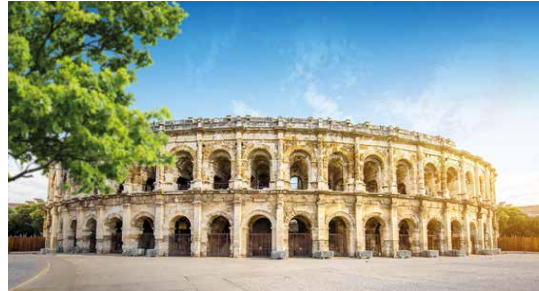
Après la chute de l'Empire, le bâtiment est utilisé comme château fort, puis se transforme en village...il faudra attendre le XIXème siècle pour rendre le bâtiment au spectacle. En 1803 les arènes sont vidées de leurs scories et deviennent en 1853 le lieu des corridas.