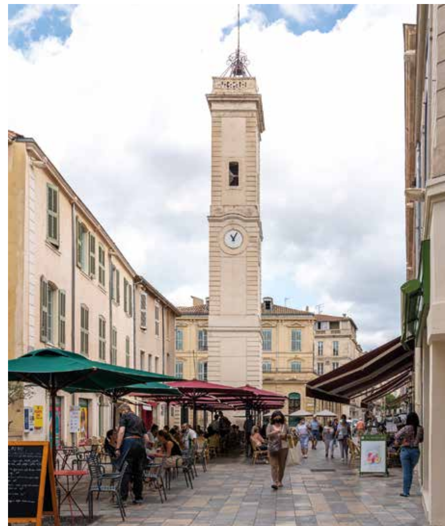
On n'appelle pas ça un beffroi puisque on est dans le sud... mais la tour de l'horloge, construite au XVIII e siècle, rythme de sa cloche, la vie de la cité.

Un des plus anciens cafés de la ville dans un décor qui n'a pas bougé depuis 1813, construit sur les anciens remparts médiévaux démolis au début du XIX e . 46 Bd Victor Hugo, 30000 Nîmes. Tél. : 04 66 05 98 25 - www.le-napo.fr