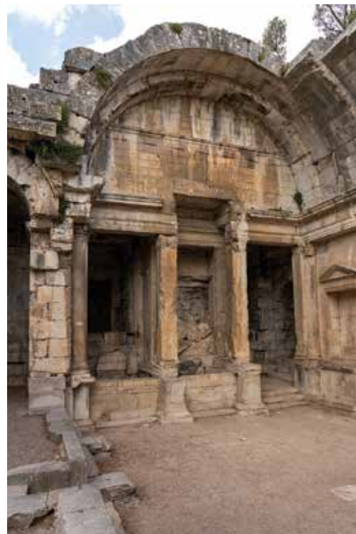
Le Temple de Diane, n'était probablement ni un temple ni dédié à Diane....Mais reste le seul et superbe, vestige antique des Jardins de la Fontaine.