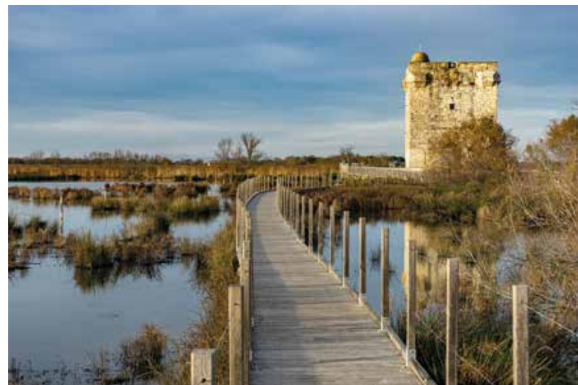
Sentinelle au cœur des marais, la Tour Carbonnière a été construite à la fin du XIII e siècle pour protéger la ville d'Aigues-Mortes.

A l'origine, Aigues-Mortes était un petit hameau de pêcheurs et de ramasseurs de sel, installés au fond d'un golfe ensablé et marécageux, entouré d'étangs. Pour en faire un point d'embarquement pour ses croisés, Louis IX fait creuser canal et port et construire la ville qu'il protège de rempart et de tours, dont la fameuse Tour Constance. Marquée par l'empreinte des croisades, des templiers, puis par les guerres de religion, c'est aujourd'hui une ville superbe, fière de son histoire et des terres sauvages qui l'entourent. ■