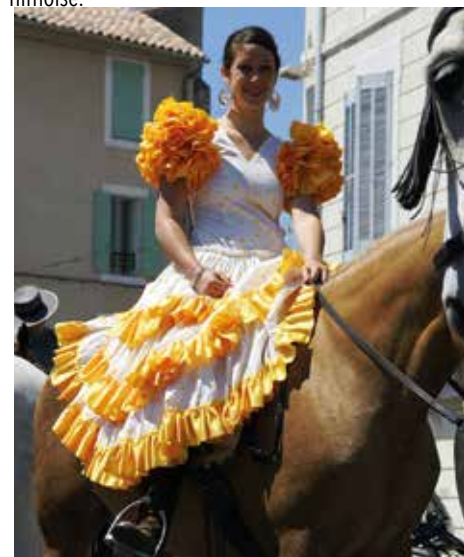
Taureaux, chevaux, un véritable art de vivre s'est développé autour de la corrida.