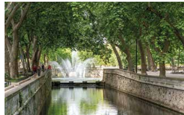
L'antique source, à l'origine de l'implantation de la ville a été canalisée... Pour d'agréables et fraîches promenades arborées.

Tout en rondeurs et légèreté, le musée de la romanité, imaginé par Elizabeth de Potzamparc face aux arènes, s'inspire d'une extraordinaire mosaïque de Penthée, découverte en 2007 et présentée dans le musée.