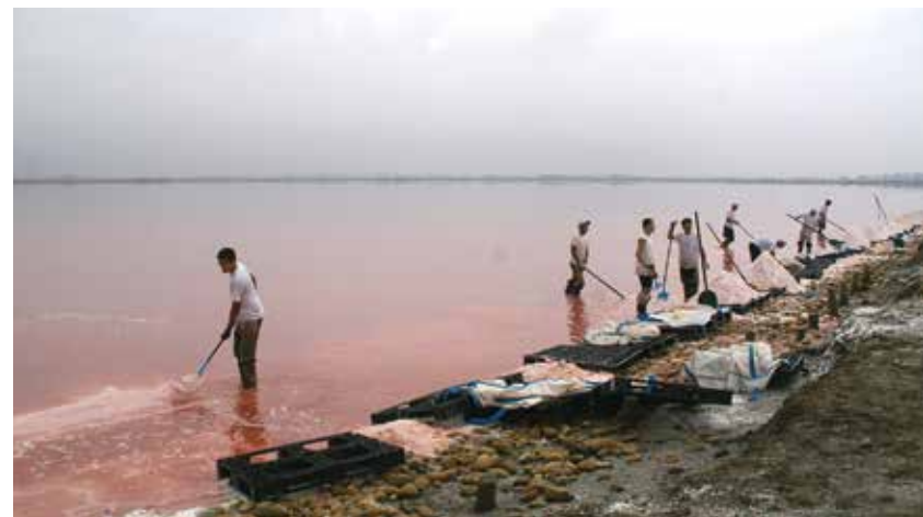
Les marais salants et l'exploitation du sel sont un des grandes richesses de cette partie de la Camargue.

Toujours aussi beau et bien décoré, 14 chambres et un restaurant. On apprécie le calme et la fraîcheur de la cour intérieure avec sa piscine dans la végétation, mais aussi la terrasse devant, qui permet de voir passer les gens ! 23 Rue de la République, 1 Bd Intérieur N, 30220 Aigues-Mortes. Tel : 04 66 53 66 56 https://hotellistempliers.ellohaweb.com