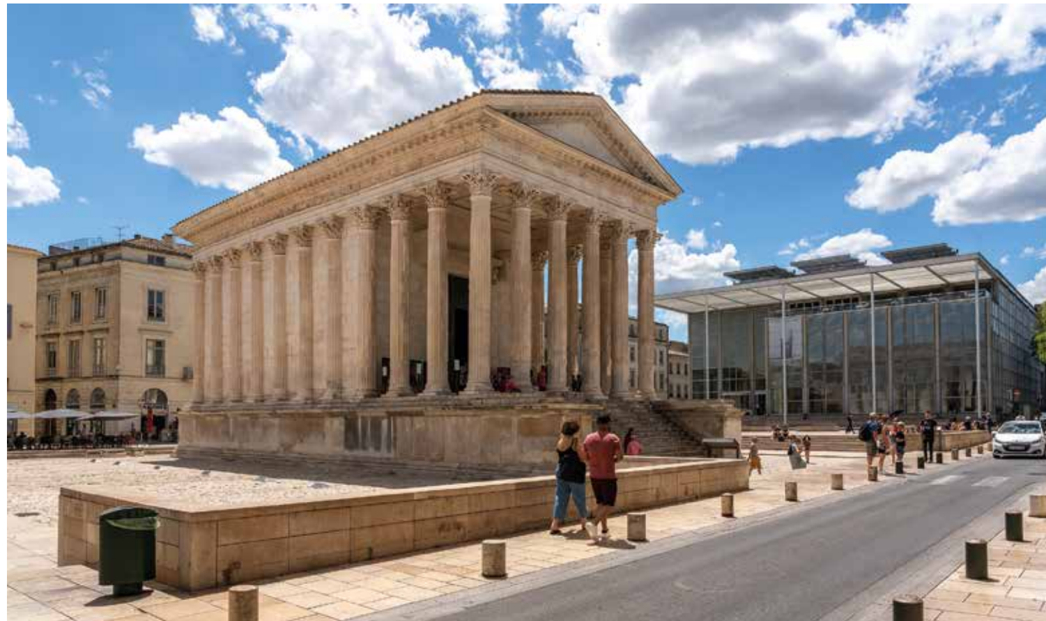
Une confrontation harmonieuse entre architecture contemporaine et ancienne avec la le Carré d'Art et la Maison Carrée. Ce temple dynastique, au riche décor sculpté de feuilles d'acanthé, construit par Auguste pour ses petits fils a traversé les siècles car il a constamment été utilisé par les Nîmois.

Anne Valéry, photos Philippe Danjou, sauf mention contraire