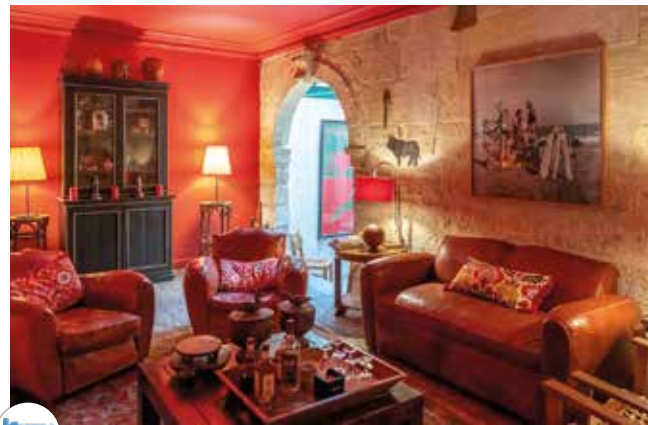
L'hôtel des templiers

Toujours aussi beau et bien décoré, 14 chambres et un restaurant. On apprécie le calme et la fraîcheur de la cour intérieure avec sa piscine dans la végétation, mais aussi la terrasse devant, qui permet de voir passer les gens ! 23 Rue de la République, 1 Bd Intérieur N, 30220 Aigues-Mortes. Tel : 04 66 53 66 56 https://hotellistempliers.ellohaweb.com