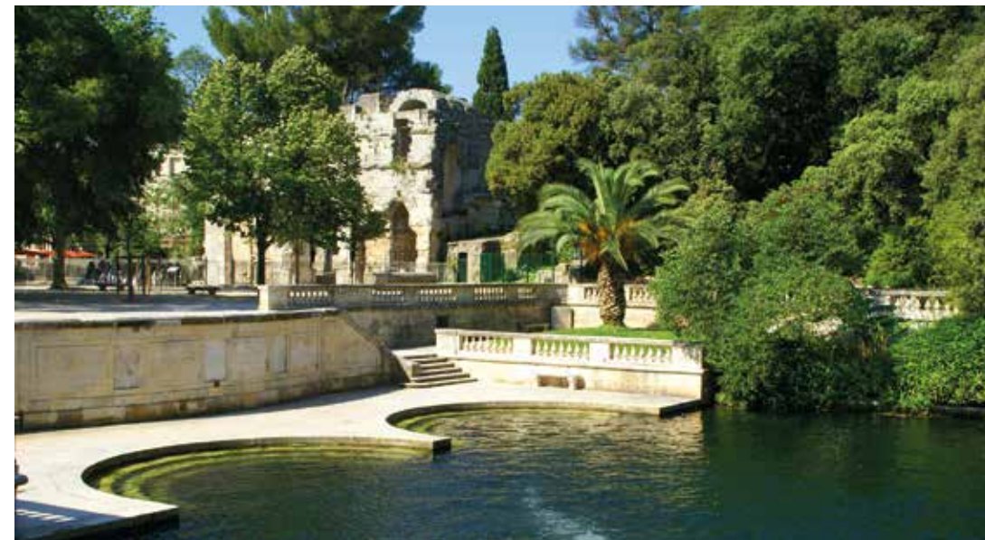
Les Jardins de la Fontaine restent un lieu enchanteur, organisé autour de la résurgence et du bassin avec ses deux escaliers semi-circulaires en pierre, construits par les Romains.