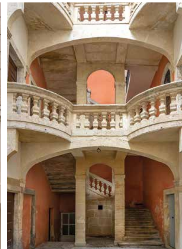
A l'Office du Tourisme, réservez la visite des hôtels particuliers qui vous offre la possibilité de découvrir de superbes bâtiments, derrière des portes bien barricadées, comme ici, l'Hôtel de Fontfroide.

Rénové depuis quelques mois, D'Hemingway à Greta Garbo, de Picasso aux plus fameux toreros comme d'El Cordobes, l'Imperator est un lieu mythique... Rénové depuis peu, il a gardé son charme d'autrefois, offre de belles chambres et suites, un jardin clos où l'on déjeune et un Spa. 15 Rue Gaston Boissier, 30900 Nîmes. Tél. : 04 66 21 90 30 www.maison-albar-hotels-imperator.com