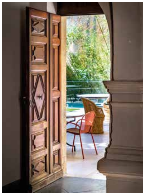
Au coeur d'un dédale de ruelles, ce bel hôtel particulier du XV e siècle, s'est transformé depuis peu en un hôtel ****. Son patio, sa cour intérieure et ses chambres en font une halte de choix. Hôtel Margaret- Chouleur, 6, rue Fresque 30000 Nîmes Tél. : +33 (0)4 48 27 08 00 www.margaret-hotelchouleur.com

Il ne vole pas son nom ce bon et beau restaurant d'où l'on domine toute la ville ! Le Ciel de Nîmes est perché au troisième étage du musée Le Carré d'Art. 1 er bâtiment en France de Norman Foster en 1993, son architecture reprend la structure à pilastre de la Maison Carrée à qui il fait face, dans une interprétation résolument contemporaine. 16 Pl. de la Maison Carrée, 30000 Nîmes. Tél. : 04 66 36 71 70