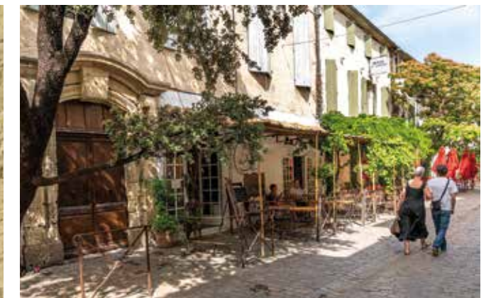
Avec son plan carré, ses rues bien droites, flanquées de maisons basses, Aigues-Mortes possède un charme fou.