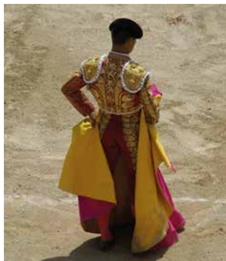
Si les arènes ont été sauvées de la démolition au cours des siècles, c'est grâce à leur utilisation continue, notamment pour les corridas, grande spécialité nîmoise.