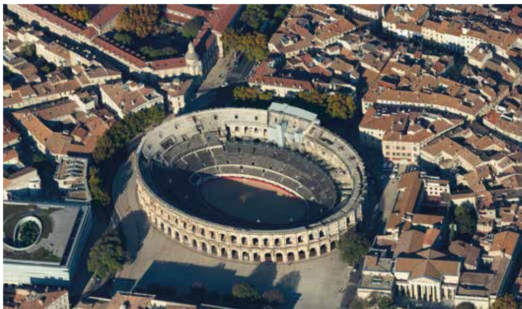
Impressionnantes, les arènes de Nîmes sont un amphithéâtre construit au 1 er siècle pour accueillir les jeux, notamment les combats de gladiateurs, dont l'école était toute proche.