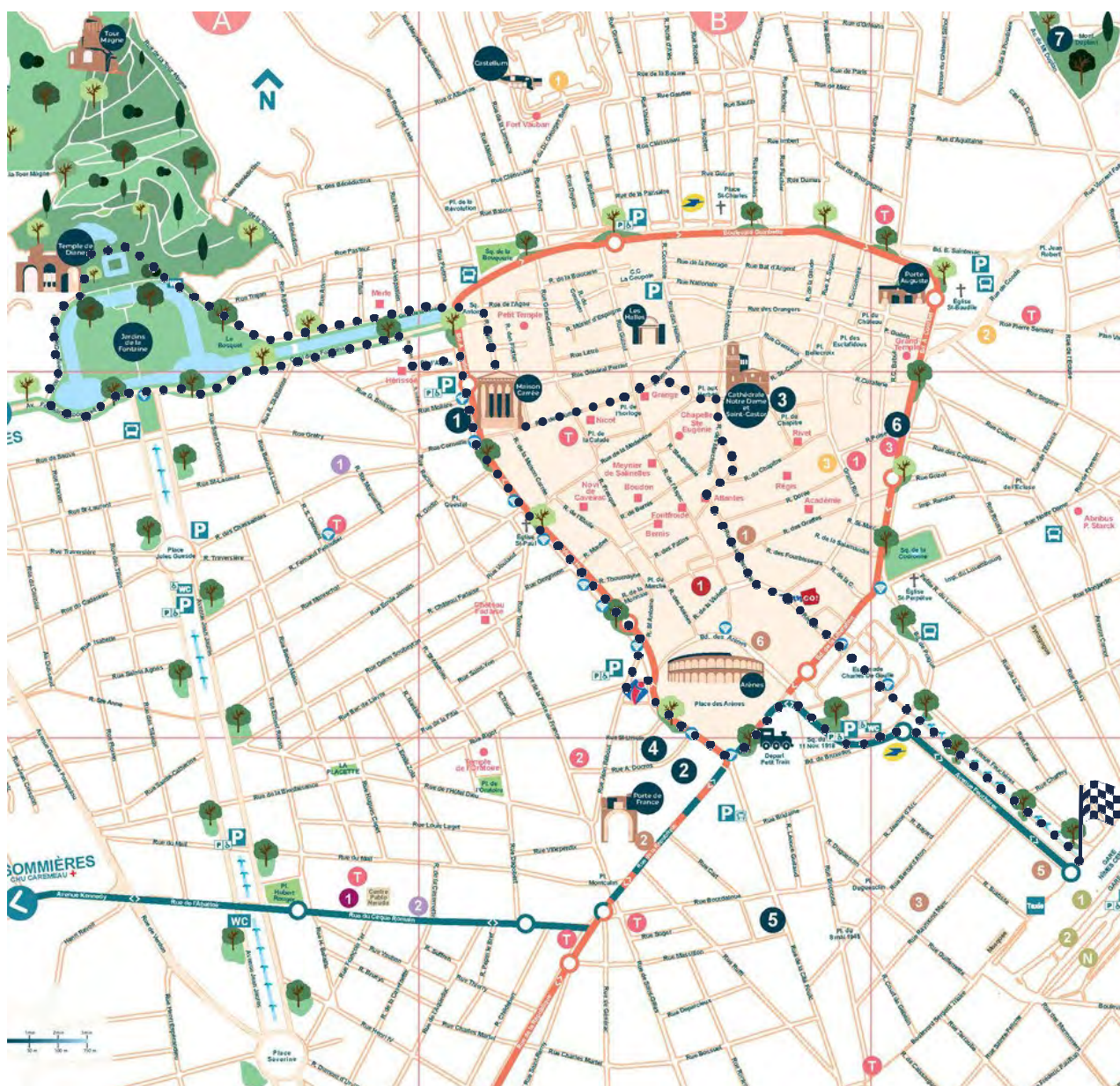
Plan de Nîmes