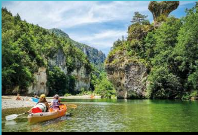
Les Gorges du Tarn sur la ligne de la Lozère et en cars IIO