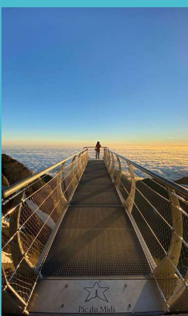
Escapade depuis Tarbes vers le Pic du Midi sur la ligne du Piémont et en cars IIO