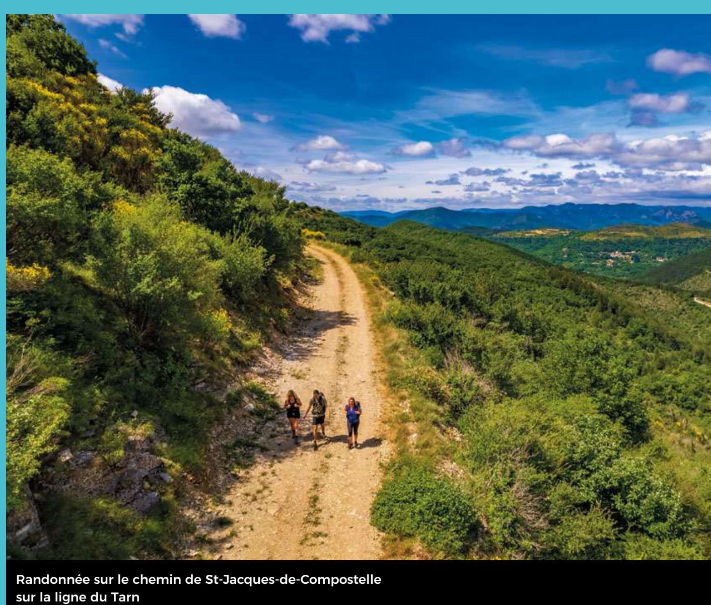
Randonnée sur le chemin de St-Jacques-de-Compostelle sur la ligne du Tarn