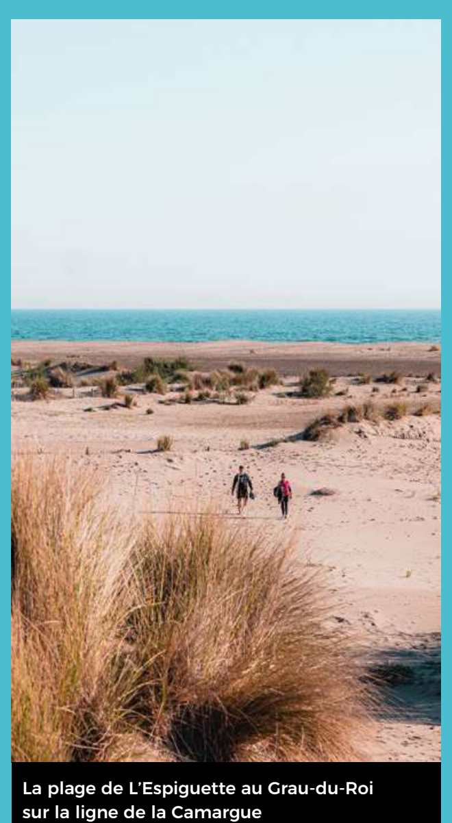
La plage de l'Espiguette au Grau-du-Roi sur la ligne de la Camargue

OCCITANIE Rail Tour A partir de 10€/jour