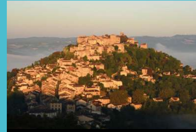
Cordes-sur-Ciel, ville médiévale perchée sur la ligne des Bastides et des Plus Beaux Villages