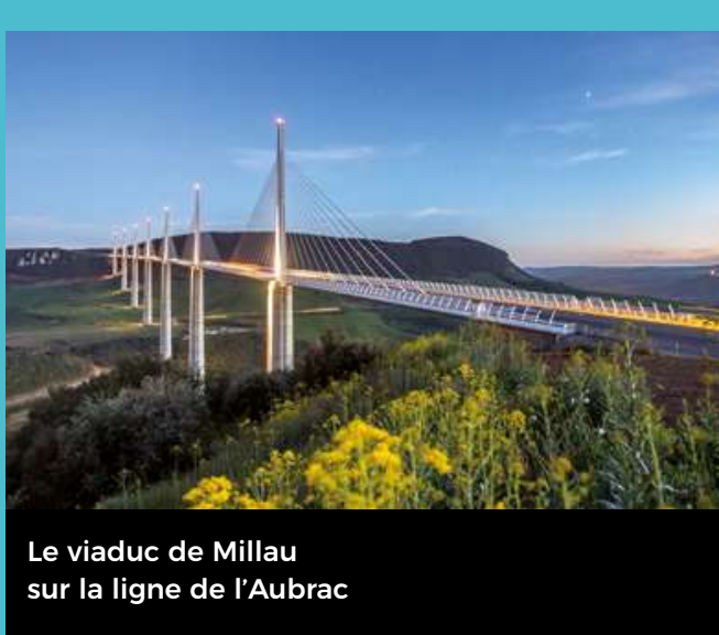
Le viaduc de Millau sur la ligne de l'Aubrac