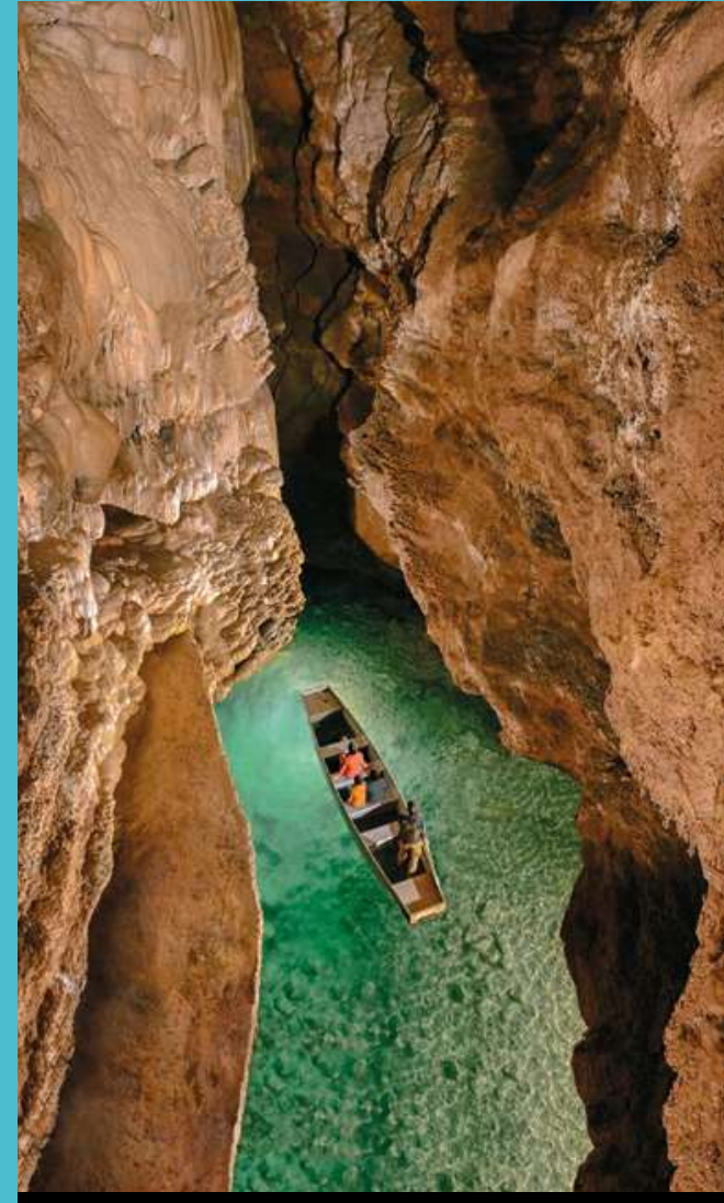
Le gouffre de Padirac sur la ligne des Causses du Quercy