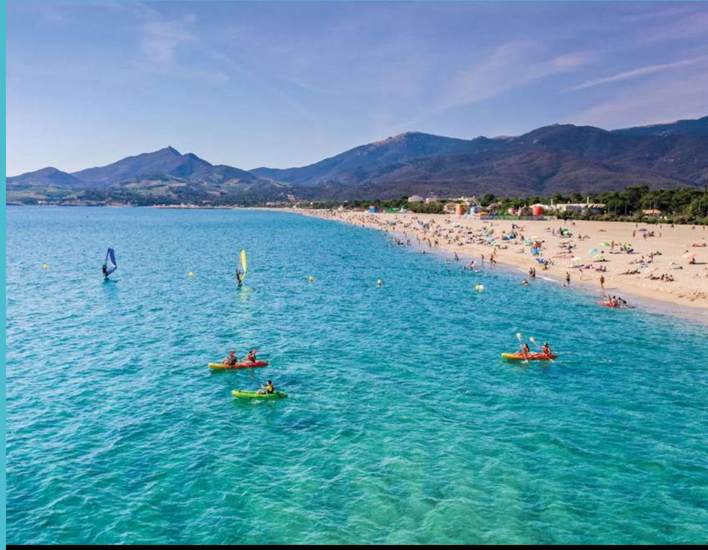
Détente à la plage sur la ligne de la Côte Vermeille