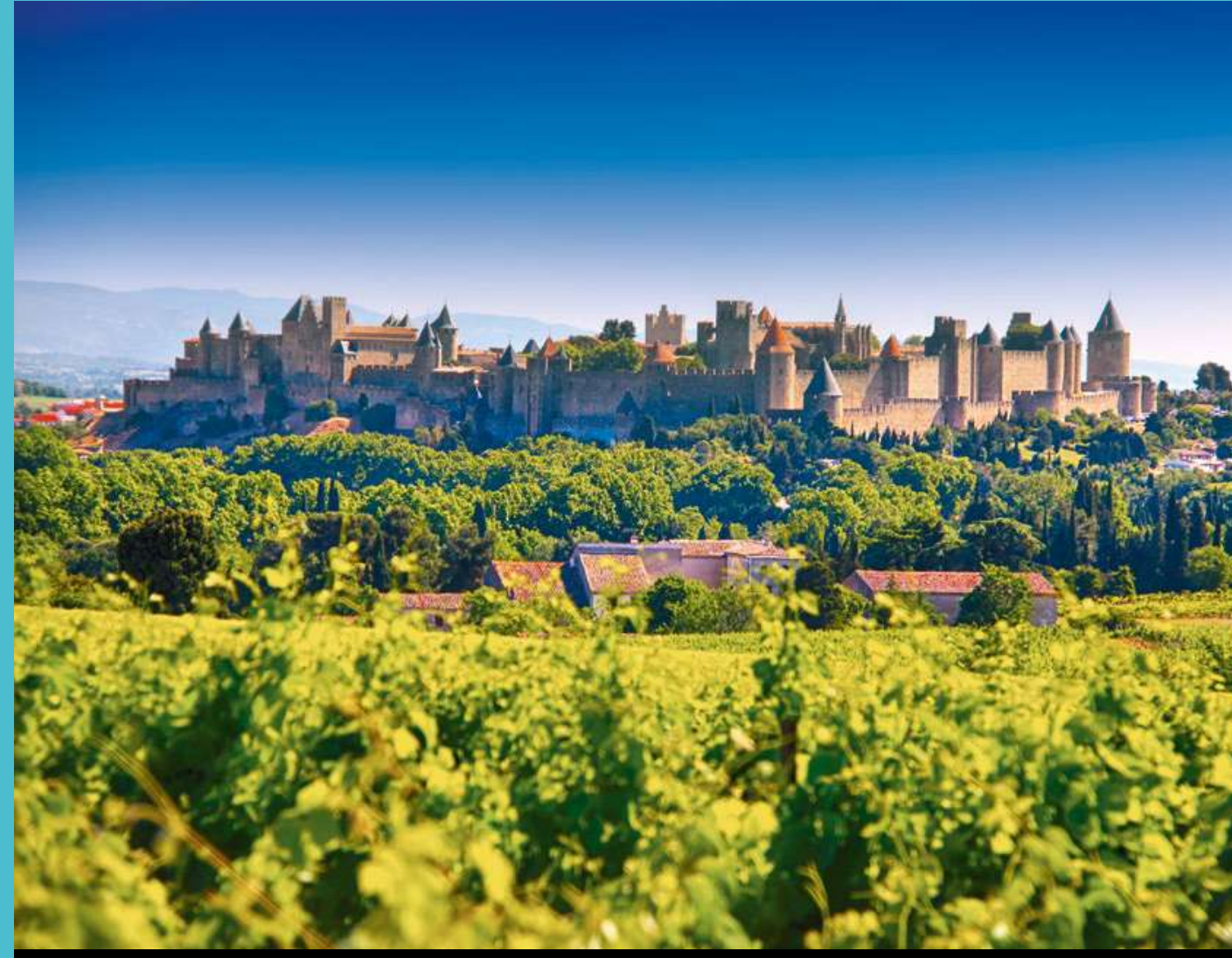
Carcassonne, ville fortifiée historique, inscrite au Patrimoine de l'UNESCO sur la ligne du Canal du Midi