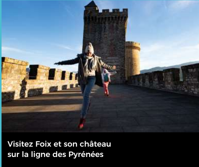
Visitez Foix et son château sur la ligne des Pyrénées