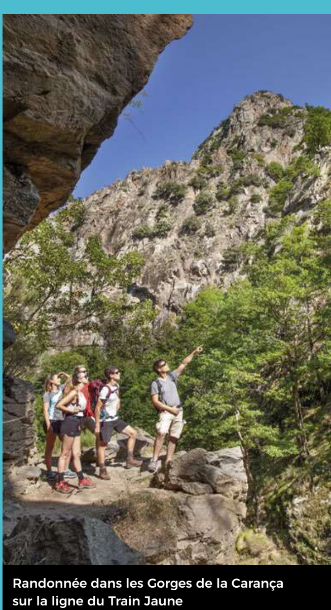
Randonnée dans les Gorges de la Carança sur la ligne du Train Jaune