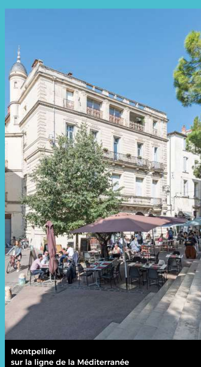
Montpellier sur la ligne de la Méditerranée