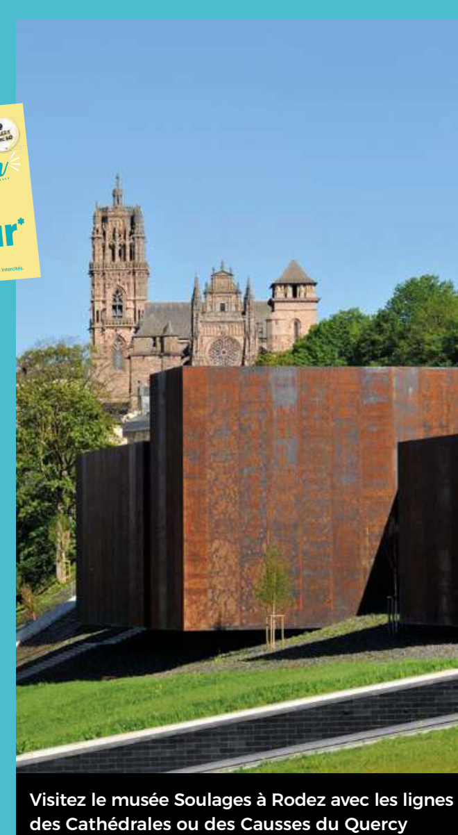
Visitez le musée Soulagès à Rodez avec les lignes des Cathédrales ou des Causses du Quercy

OCCITANIE Rail Tour A partir de 10€/jour