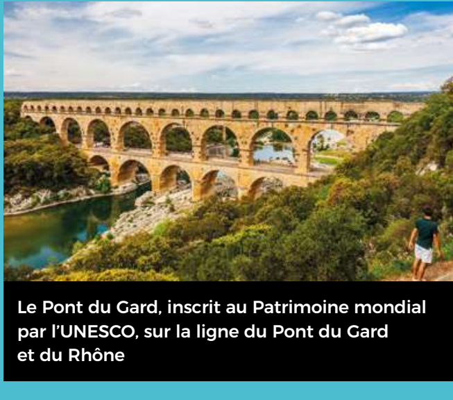
Le Pont du Gard, inscrit au Patrimoine mondial par l'UNESCO sur la ligne du Pont du Gard et du Rhône