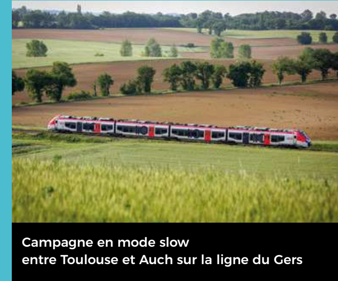
Campagne en mode slow entre Toulouse et Auch sur la ligne du Gers